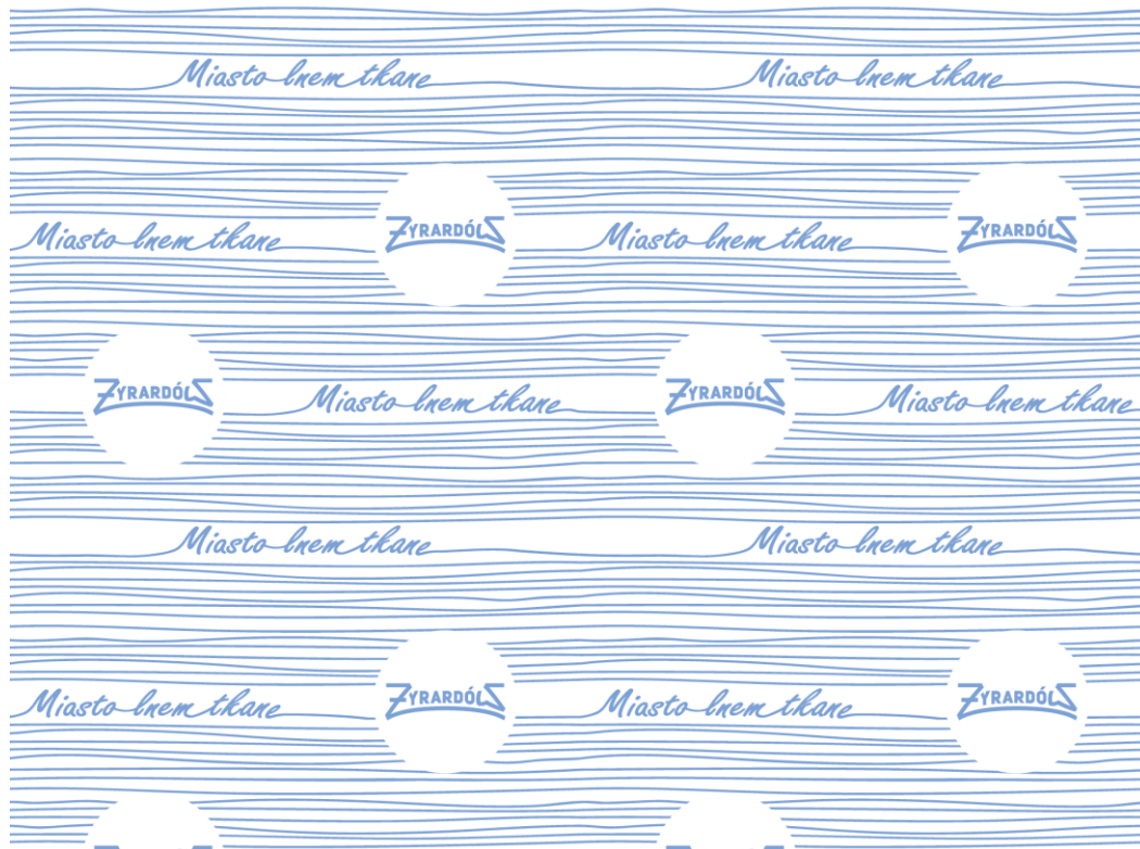
Plik graficzny 1. Pełny wzór tkaniny